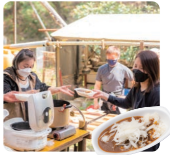
▲お待ちかねの昼食タイム!理事長特製のカレーが作業を終えたメンバーの労をねぎらう。 ◀この地が一人ひとりの特別な場所になることを願って寄付を募り、植えられた桜たち。各桜のプレートには植樹者のメッセージが添えてある。