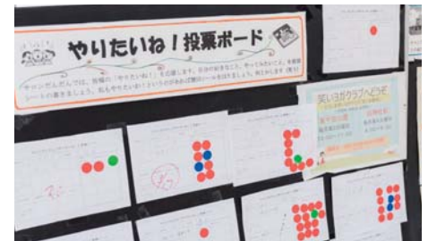
自分のやりたいを提案できる「やりたいね!投票ボード」。3票以上入れば、次回サロンの実施候補に。