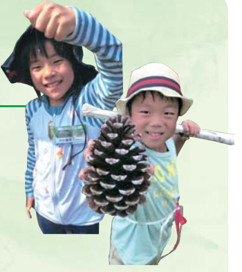
よく飛ぶ竹水鉄砲を自分たちで制作し、合戦ゲームで勝負!