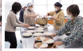
昼食は「マダムアキコのカレーライス」。