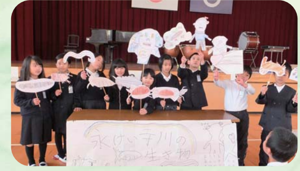
永慶寺川の生き物や水系、暮らしとのつながりなど、展示会形式で学べる「AKGいいとも博」を開催。