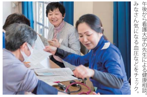
午後から看護大学の先生による健康相談。みなさん気になる血圧などをチェック。