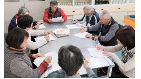
「お茶の間サロンだんだん」のアフターミーティングで、ふりかえりと次回の打合せを。

取材協力/ 特定非営利活動法人 おおの風 メールアドレス: ohno-kaze@nifty.com ホームページ: http://ohno-kaze.net