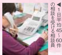
↑1日平均45～60件の相談を受ける相談員