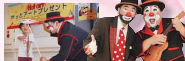
▲生まれてはじめての皿回しに大興奮