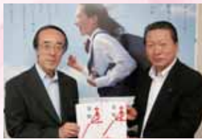
▼「あしなが育英会」への寄付目録贈呈