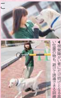
↑視覚障がい者にだけ妨げとなる高い位置の物も避けて誘導できる訓練

■くわしくは… 日本盲導犬協会 http://www.moudouken.net/ 島根あさひ訓練センター http://www.moudouken.net/center/shimane/