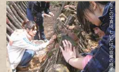
※この写真はしいたけの収穫の様子

椎茸菌を繁殖させてある駒を、木に打ち込む「コマ打ち」体験や森の学校の散策をします。