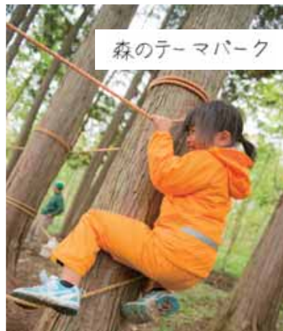
森のテーマパーク

「森のテーマパーク」では、木にロープを巻いたアスレチックやターザンロープなど、身体を使いながら木と触れ合う体験を。また、「昔遊びコーナー」では、けん玉やお手玉、こま回しにおはじきといった昔の遊びを、大人も子どもも一緒になって楽しみました。「里山市場」では地元産の高原野菜や富有柿などを販売。新鮮採れたての里山の幸はあつという間に売り切れていました。