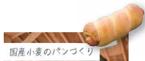
国産小麦のパンづくり

広々とした万代池ではカヌーを体験! 初めてでも先生が優しく教えてくれるから、すぐに上達しました。