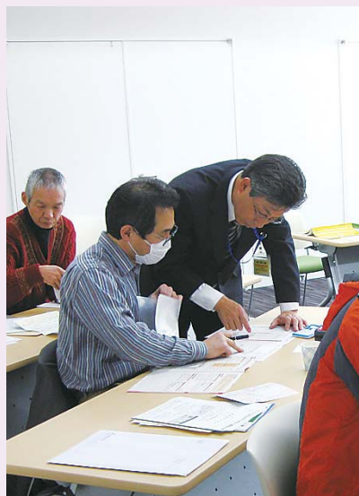
不明な点はすぐ質問して、すぐ解決!