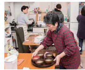
空き店舗を改装した「基町の家」。1階は食事スペース、2階は相談スペースになっている。

2016年12月にオープンしたばかりの「基町の家」では、年末年始をのぞいて毎日食事が提供されています。施設の開放時間は午前11時～午後8時。開放中は昼食と夕食が提供されます。ちなみにオープン後、「基町の家」で作られたごはんは1カ月間で855食。1日あたり30食近くが作られています。これだけの食事を賄う費用を捻出するのも大変! 同会では会員や寄付を募るだけでなく、バザーを開催するなどして切り盛りしていますが、それでも追いつかないそう。より多くの方からの温かいご支援をお待ちしています、とのこと。