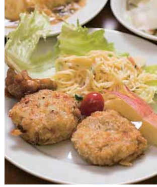
本日のメニューは天津飯にコロッセ、スパゲティサラダ、チキン味噌汁とボリューム満点!

「どうしてこんな大変な活動をしているの?なぜ、続けられるの?」と、いろんな方から聞かれます。その度、答えに困ってしまうのですが、私のもとには、「お腹が空いた。親が帰ってこない」と、子どもたちからのSOSが毎日のように届きます。虐待や育児放棄のせいで飢えや孤独に苦しむ子どもの過酷な現実を知って、「なんで?」と立ち止まっている余裕はありません。私たちができる支援は些細なことかもしれませんが、それでもお腹が満たされることで、非行がひとつ消えるかもしれない…。子どもたちを救う協力の輪を広げるには、子どもの辛い現実と向き合う大人たちの理解と支援が必要です。