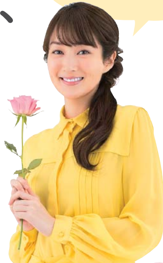
ろうきんイメージモデル 高梨臨