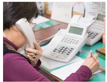
▲1日平均45～60件の相談を受ける相談員

2017年4月1日から2018年3月31日までのご契約やご利用が対象となります。原則として3カ月に1度、〈ろうきん〉が当該商品のご利用・実績にもとづき寄付金をまとめ、中国5県の「いのちの電話」に寄付いたします。