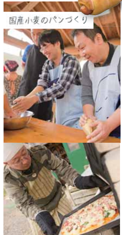
国産小麦のパンづくり

フェスティバルの人気企画は、国産小麦を使ったパンづくり。今日はカレー味のウィンナーロールやフォカッチャ、ピザもつくりました。手造りの石窯で焼き上げたら、格別の美味しさ!